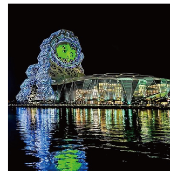
高雄ポップミュージックセンター(高雄市)

五つの水路状の港があったことから「五条港」と呼ばれた赤崁樓の西側エリアは、清朝時代には米と砂糖の貿易で栄えました。一時衰退した時期もありましたが、古民家をリノベートし、レトロ感あふれる街並みをつくり出したことで活気を取り戻しました。特に人気の高い神農街は、古き良き街並みの中で現代のセンスが光る雑貨店やカフェが営まれ、その奥には歴史を感じさせる薬王廟があります。昔を偲びながら、100年を経てなお問題なく利用できる台湾の建築技術を目の当たりにできるでしょう。