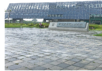
国立台湾歴史博物館(台南市)

2007年に開館した台湾史を主題とする唯一の国立歴史博物館。「斯土斯民:臺灣的故事(この土地、この民:台湾の物語)」と題する常設展では、人類が最初に台湾島に上陸した紀元前から民主化後の今日に至るまで、様々な人が出会い、模索し、共有してきた台湾の歴史が一つの物語として描かれ、楽しみながら体系的に理解できます。漫画、鉄道、スポーツ、教育など、多様なテーマを取り上げる特別展も見応えがあります。