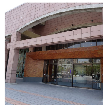
高雄市立美術館(高雄市)

水都高雄を象徴する愛河が海に注ぐ愛河湾に位置する高雄ポップミュージックセンターは、現代音楽文化の一大ランドマークです。人目をひく前衛的な建築は、台湾とスペインのチームが共同設計したもので、トレブルタワー、バスタワー、サンゴ礁、クジラの堤防、イルカの遊歩道、LIVE WARE HOUSEの各エリアで構成されています。港町として栄えた高雄の歴史を取り込み、海を象徴する意匠を取り入れた建物から、地域の特徴を生かす現代建築についての理解を深めることができます。