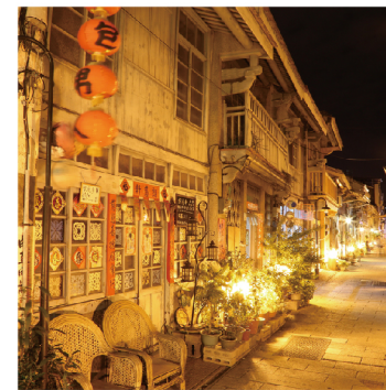
五条港文化園區(神農街)(台南市)

台南市美術館1館一帯は日本統治時代の官庁街です。1998年に台南市の古蹟に指定された美術館の建物は警察署として利用されていました。戦後も引き続き2010年まで台南市政府警察署庁舎として機能し、その後、台湾と日本の設計事務所の共同作業で美術館に生まれ変わりました。1930年の竣工時、建物の壁面には当時台湾で流行した素焼きのレンガが使用されていました。後に紅漆で着色されましたが、リノベーションにより当初の土色の壁面が復活しました。