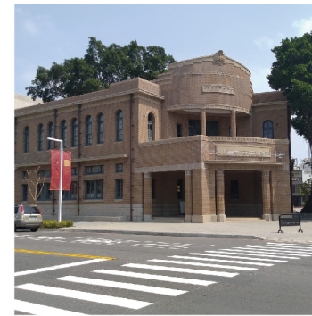
台南市美術館1館(台南市)

2007年に開館した台湾史を主題とする唯一の国立歴史博物館。「斯土斯民:臺灣的故事(この土地、この民:台湾の物語)」と題する常設展では、人類が最初に台湾島に上陸した紀元前から民主化後の今日に至るまで、様々な人が出会い、模索し、共有してきた台湾の歴史が一つの物語として描かれ、楽しみながら体系的に理解できます。漫画、鉄道、スポーツ、教育など、多様なテーマを取り上げる特別展も見応えがあります。